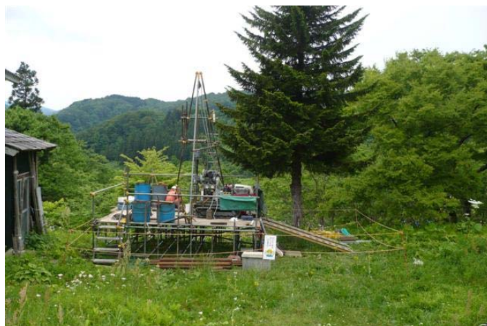
各所で行われているボーリング作業(地下水排除)