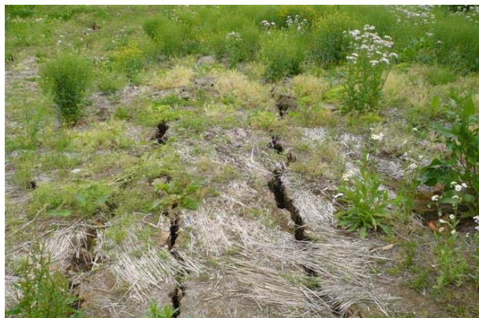
各所で見られる地面の亀裂