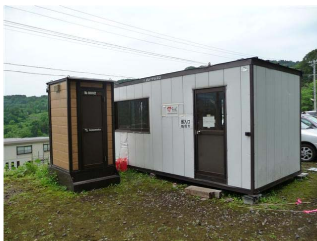
七五三掛地区地すべり地域災害対策 現地本部 (鶴岡市)