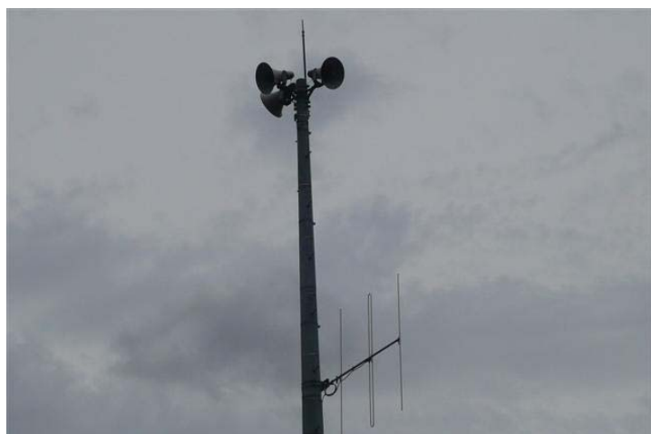
防災行政無線同報系屋外拡声器 * 各戸には戸別受信機も設置