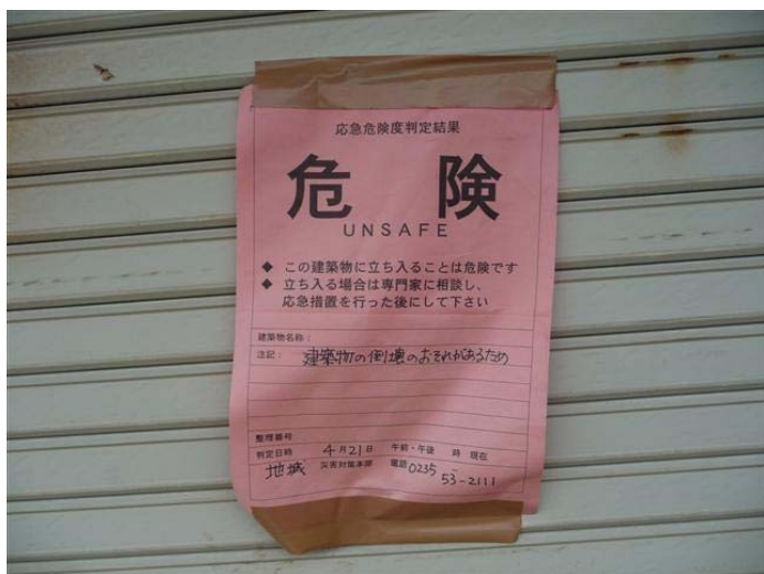
震災以外では珍しい応急危険度判定票