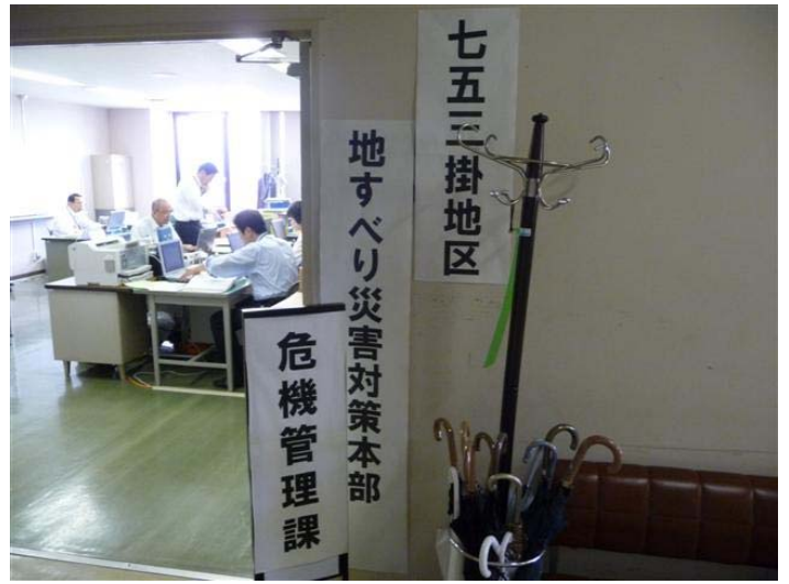
市役所内の災害対策本部室入口 * 通常の所管部署で運用