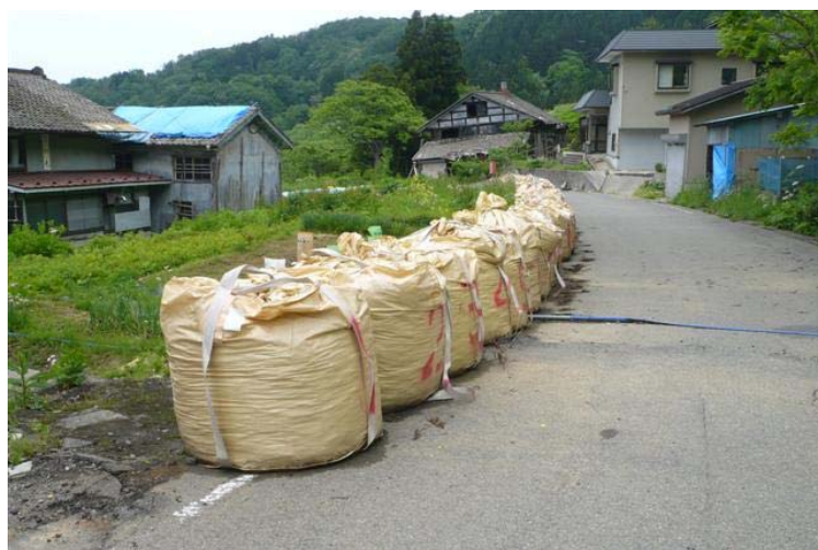
並べられた巨大な土嚢