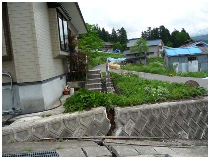
大きな被害を受けた住宅