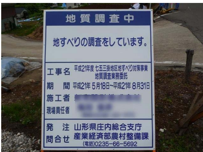
地質調査中の看板