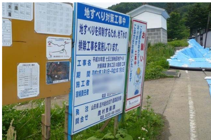
地すべり対策工事案内看板