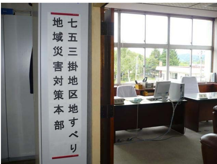
朝日庁舎内「地域災害対策本部」室 * 市長・支所長室で運用。毎朝会議。