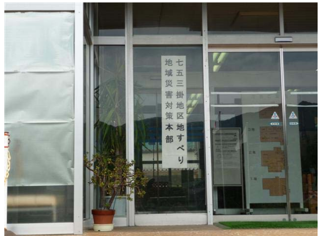
鶴岡市朝日庁舎玄関 * 旧朝日村 (H17. 10. 1 6市町村が新設合併)