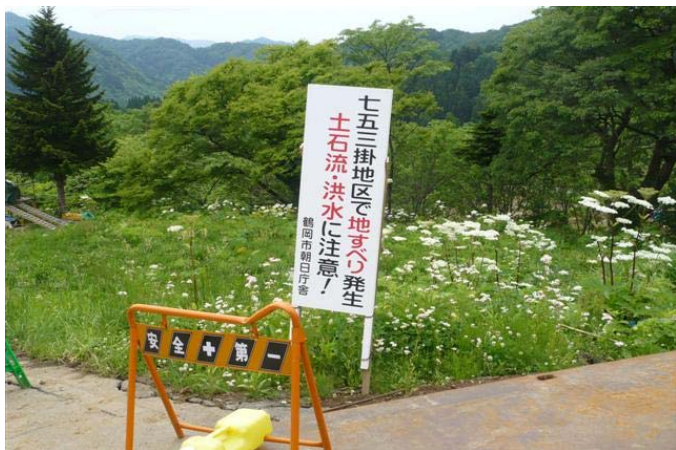
各所に立てかけられた注意喚起看板(1)