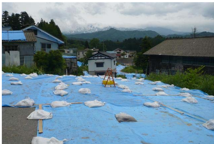
雨水の浸透を抑止するため一面に張られたシート