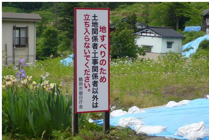
各所に立てかけられた注意喚起看板(2)