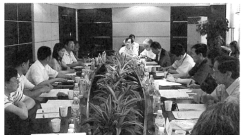
四川省政府高官と意見交換しながら、現地 で何が必要とされているかを聞いた

成都市、徳陽市の副市長や波川県の県 長などそのメンバーの大半が、被災地の最 前線で復旧・復興の陣頭指揮を執っている 責任者であった。