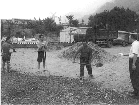
9.6 仮設住宅敷地に砂利を撒く住民

ていく姿をぜひまた視察いただきたいとの言葉に、災害に負けずに頑張る中国被災者のたくましさや意気込みを感じたそうである。