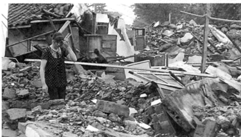
九龍鎮 集められた被災住宅の瓦礫