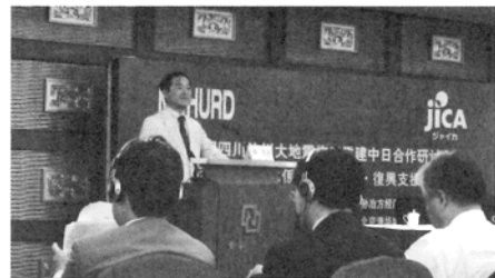
北京の復興セミナーでの基調講演

講演では、中越地震の経験を踏まえ、仮設住宅の入居・運営は、コミュニティの維持を大切にすべきこと。第二に、復興にあたっては、行政は被災者の自助努力を引き出す政策に取り組むことが肝要であること、またその際は自助、共助、公助の調和が大切であること。第三に、行政が安価で耐震性や景観・環境などに配慮したモデル住宅を開発し、住民や建設業者に示すことが有効であ