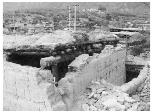
羅卜寨の被害の様子