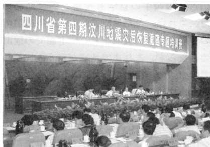
9.5 四川省党幹部育成学校での講演風景

9月5日に四川省党幹部育成学校で講演をされた先生からは、その後の四川省建設庁役員との会談や震源地の波川県の視察を含め、以下のとおりご報告を受けている。この研修会は、四川省の139の地域の自治体の復興リーダーを対象としたもので、朝9