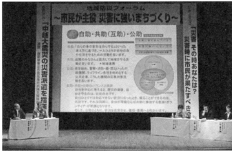
地域防災フォーラム

で伝えたい暮らしの情報ランド」という番組を毎日放送しています。開始当初は、通常の発音に比べてゆっくりとしたスピードで、リスナーが聴き慣れないことなどが理由で、聴きづらいといった意見も一部から寄せられたようですが、「やさしい日本語」を普及させたいという強い熱意と、アナウンサー研修や試行錯誤を重ねた地道な放送の継続によって、市民の間でも浸透しつつあります。