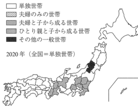
最大の家族類型別割合をもつ家族タイプの推移

少子・高齢化にはいくつかの節目があり、2006年には高齢者が5人に1人になり、2015年には4人に1人となり、世帯類型は正常なら親子で構成される世帯が多いことが通常であるが、2020年には35都道府県で単独世帯がトップになることが予測され