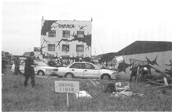
写真1 訓練用仮設建物 「実際には存在し得ない建物…訓練に合わせて設置」

訓練の内容も、特に構築物等を配置しない限り、防災関係機関が日常個別に行っている訓練と大差がないもので、消防の消火、救急救助、警察の交通規制、自衛隊の支援活