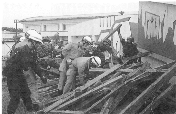
写真2 消防、警察、自衛隊の連携 「合同指揮による連携した救出活動」

動、ライフライン(和製英語ですが一般に使われているので生活関連施設という意味で使います。)機関の工事と変わり映えがしないものになっています。