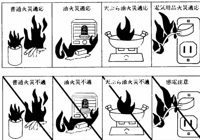
図2 適応（不適応）火災の表示