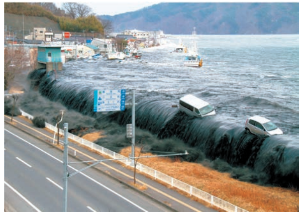
写真2 3月11日午後3時23分。真っ黒に染まった波は水位を上げ、ごう音とともに市街地へと流れ込んだ

からはただ防潮堤から乗り越えてくる水を注視している以外、為す術がなかったというのが本音である。