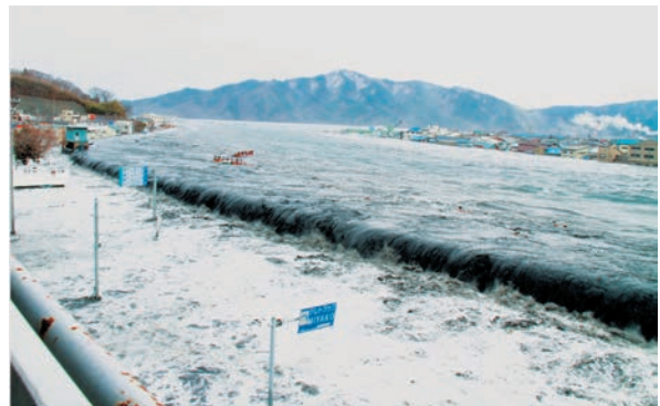
写真3 3月11日午後3時25分。防波堤より高くなった海面。波は堰を切ったように一気に市街地へとあふれ込む

言うまでもないが津波は文字通り波状で襲来する。当然押し寄せた波はものすごい勢いで引いていく。この時には破壊した建物、車輛等が引き波によって海に押し出されていく。私は半分ぐらい水没した車両の窓に手と顔をつけたままの市民が目の前を流されていくのを息を殺して見送るしかなかった。車輛の電気系統が破壊され、窓を開けられず、水圧によりドアも開かない状況で流されていったもので残念ながら、犠牲となったものと推測している。