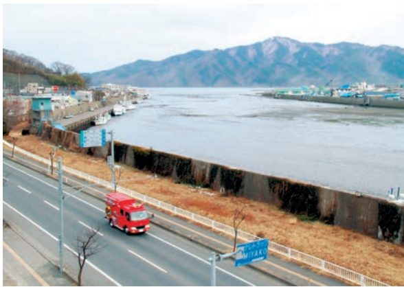
写真1 3月11日午後3時18分。底が見えるほど潮が引いた閉伊川。避難を呼び掛ける消防車が防波堤沿いを走る

いことから、とっさの判断で庁舎の1～2階の来訪者を職員に案内させ6階の大会議室に避難誘導させた。これらを行いながらも大津波警報発令時の危機管理マニュアルに従い、市内各所に指定してある避難所の開設を担当する初動班はそれぞれの担当避難所へ出動していった。その後庁舎テラスから水面監視していた職員から水面に著しい変化が表れているとの報告があり、確認するためテラスに出てみると、普段3メートル程の水位のある川が底を見せており、急激にその範囲が拡大している状況で、大津波の襲来を覚悟した。